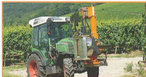
Effeuilleuse EB 490 unilatérale