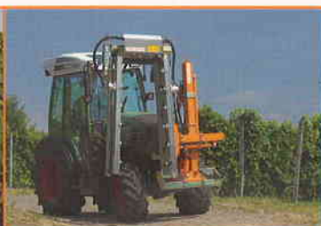
LSA 320 AU3P