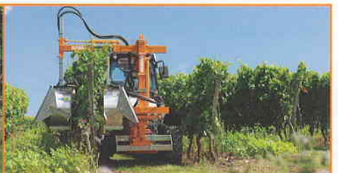
Effeuilleuse EB 490 un rang complet

Binger Seilzug GmbH & Co. KG Saarlandstraße 246 | 55411 Bingen | Allemagne Tél.: +49 (0)6721/309648-0 | Fax: +49 (0)6721/309648-50 E-Mail: info@Binger-Seilzug.de