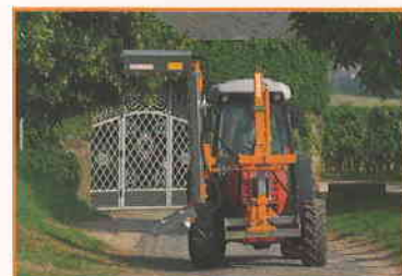
LSA 320 ALJ3

Des consoles pour le montage au dessus du capot sont également disponibles. Des modèles spéciaux et des distributeurs sont livrables sur demande.