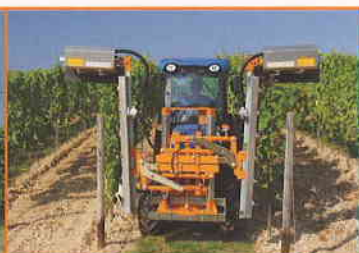
LSA 320 ALL4

Binger Seilzug GmbH & Co. KG Saarlandstraße 246 | 55411 Bingen | Allemagne Tél.: +49 (0)6721/309648-0 | Fax: +49 (0)6721/309648-50 E-Mail: info@Binger-Seilzug.de