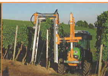
LSA 320 AU3V