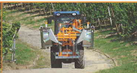
Effeuilleuse EB 490 bilatérale